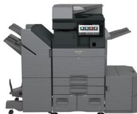
デジタルフルカラー複合機<BP-70C65>