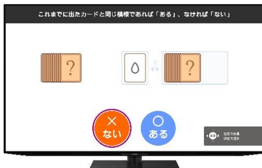
『今日の脳トレ』の「カード記憶」ゲーム画面（イメージ）