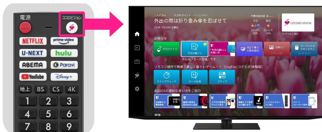
リモコンの『COCORO VISION』ボタンで簡単に起動

テレビの使い方の幅を広げ、“おうち時間”がより楽しくなる情報を紹介するエンタメ・生活情報サポートアプリです。自宅で手軽に楽しめる趣味・教養・健康などのさまざまな動画コンテンツをテーマごとにおすすめ。「AQUOS」の大画面で、生活に役立つ便利な情報をお楽しみいただけます。さらに、話題のドラマや映画などのVOD作品や最新のエンタメ情報をタイムリーにお届けします。