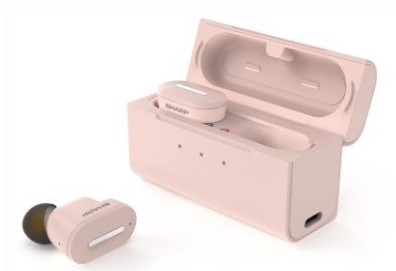
<本体と充電ケース>