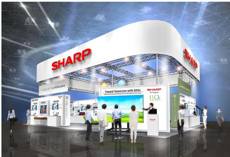
当社ブースイメージ（幕張メッセ会場）

シャープは、10月18日（火）から21日（金）まで幕張メッセ（千葉市美浜区）で開催される「CEATEC 2022」に出展します。