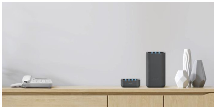
本機とhome5G<HR01>を並べて設置したイメージ

シャープは、回線工事不要の簡単設置で、LTEネットワークを利用した固定電話サービスが使用可能になる専用機器「homeでんわ」<HP01>を商品化します。株式会社NTTドコモより、2022年3月下旬以降に発売予定です。