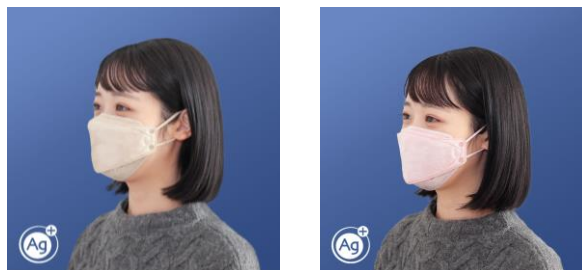
マスク着用姿 左：新色（ベージュ系）、右：新色（ピンク系） ●製品の色味は画面の見え方により、実際と異なる場合があります。

『シャープクリスタルマスク』は、プレミアムタイプの不織布マスクとして、快適性や衛生面（防御力）、着用時の美しさを追求し、2021年9月の発売以来、多くの皆様からご支持をいただきました。今回、ホワイト系以外のカラーを求めるお客様の声にお応えし、「ふつうサイズ」（15枚入り）に、2つの新色（ベージュ系とピンク系）を追加します。本日12月19日にベージュ系、来年1月中旬にピンク系を当社ECサイト（COCORO STORE）にて発売します。