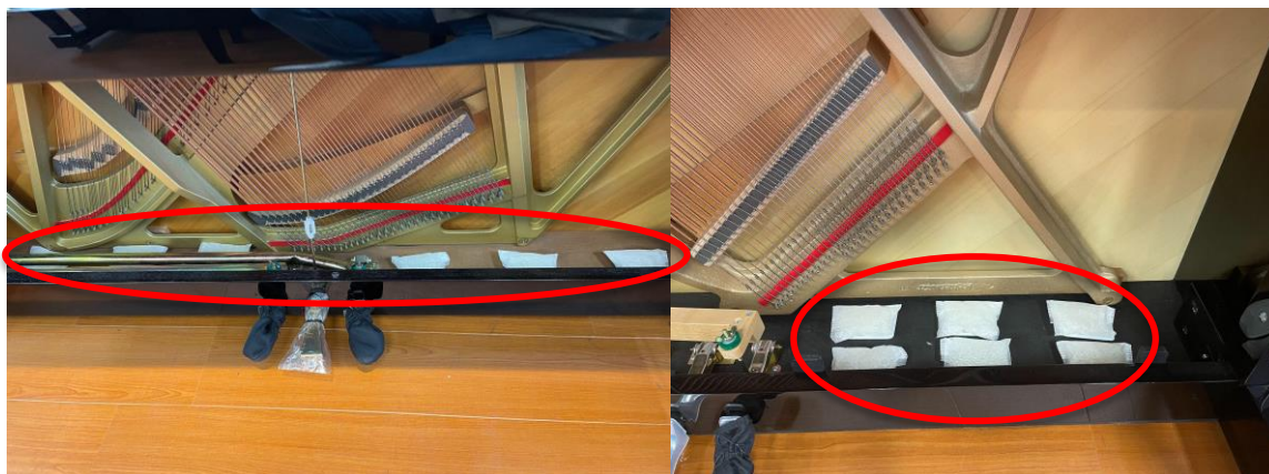
アップライトピアノ内部への設置例

島村楽器とシャープは、1年以上の時間をかけ、島村楽器の店頭や一般家庭に置かれたアップライトピアノ内部の湿度推移データを共同で抽出・検証して開発を進め、今回の発売に至りました。両社は、今後も楽器の品質維持に役立つ製品の開発・普及に取り組んでまいります。