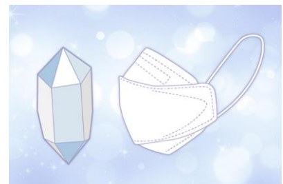
立体クリスタル形状のイメージ (左:水晶、右:シャープクリスタルマスク)