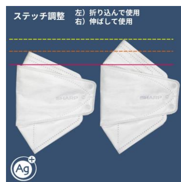
ステッチによるサイズ調整

鼻の部分に施されたステッチ（縫い目）を利用して不織布を下方方向に折り込むことで、マスクの縦方向のサイズ調整が可能です。個人ごとにフィット感の高いポジションでマスクを装着いただけます。