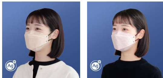
左：本体 ベージュ系／耳ひも グリーン系、右：本体 ピンク系／耳ひも レッド系 ●製品の色味は画面の見え方により、実際と異なる場合があります。

『シャープクリスタルマスク』は、プレミアムタイプの不織布マスクとして、快適性や衛生面（防御力）、着用時の美しさを追求し、2021年9月の発売以来、多くの皆様からご支持をいただきました。今回、「服装に合わせてマスクを選びたい」「その日の気分に合わせてマスクを着用したい」といったお声に応え、本日5月15日より、『シャープクリスタルマスク（ふつうサイズ）』に2種類のバイカラーモデルを追加し、当社ECサイト（COCORO STORE）にて販売を開始します。