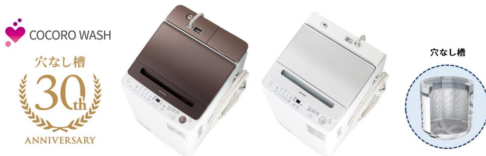
左から、「穴なし槽シリーズ」全自動洗濯機<ES-SW11H/GV10H>

シャープは、清潔・節水を実現する当社独自の「穴なし槽」を採用し、新たに「液体洗剤・柔軟剤自動投入」機能を搭載した全自動洗濯機<ES-SW11H>と、デザインを一新した<ES-GV10H/GV9H/GV8H/GV7H>の計5機種を発売します。