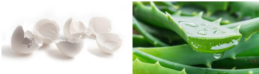
卵殻膜（左）とアロエベラ葉エキス（右）のイメージ

また、保湿成分として沖縄県宮古島産のアロエベラ葉エキスを配合しており、この原料の売上の一部が宮古島のサンゴ礁保護活動を行う団体に寄付されます。