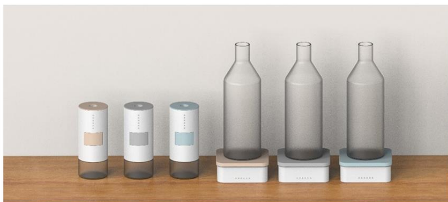
*デバイスは下部のトレイのみ。上部のボトルはイメージです

調味料IoTデバイス『ソルとも (Saltomo)』(左「プッシュタイプ」、右「トレイタイプ*」)