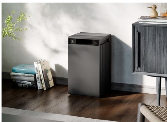
プラズマクラスター空気清浄機 <FX-S/FP-Sシリーズ>