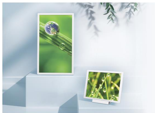
カラー電子ペーパーディスプレイ 『ePoster (イーポスター)』

シャープのプラズマクラスター空気清浄機<FX-S/FP-Sシリーズ※ 1 >、カラー電子ペーパーディスプレイ『ePoster』が『2024年 iFデザイン賞』を受賞しました。