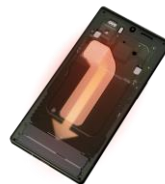
バイパーチャンバーが下方向に内部の熱を拡散させるイメージ

※4 RAMの容量を超える作業（メモリ不足）が発生した場合に、現在使用していないデータをストレージに存在する専用領域に一時的に移し、RAMの容量を空けることを指します。