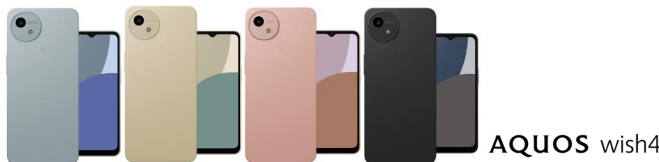
「AQUOS wish4」(左から、ブルー、ホワイト、ピンク、ブラック)

シャープは、ベーシックモデルのスマートフォン「AQUOS wish4」を商品化。ソフトバンク株式会社の“ワイモバイル”より発売します。ディスプレイを大型化しながらも割れにくくし、電池持ちも大幅にアップ。スマホを初めてお使いになる方にも安心の機能が充実した、幅広い年代のライフスタイルにフィットするモデルです。