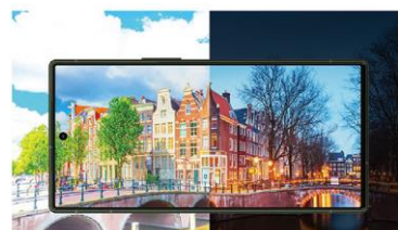
Pro IGZO OLEDのイメージ

※5 「Qualcomm® Snapdragon Sound™」に対応したイヤホンが必要です。