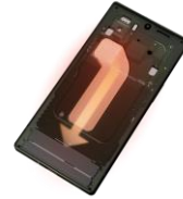
バイパーチャンバーが下方向に内部の熱を拡散させるイメージ

※4 RAMの容量を超える作業（メモリ不足）が発生した場合に、現在使用していないデータをストレージに存在する専用領域に一時的に移し、RAMの容量を空けることを指します。