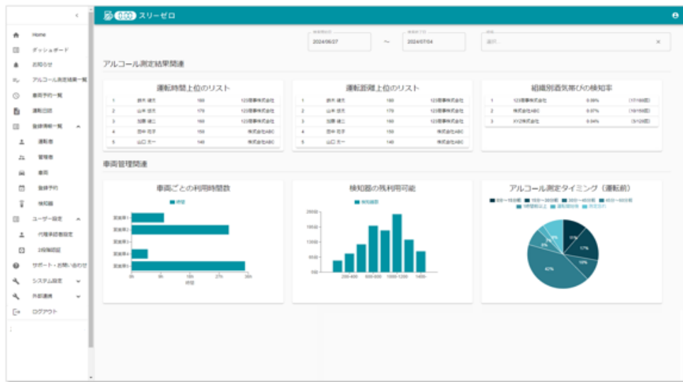
「ダッシュボード機能」（画面は開発中のものです）

今回、新たに「ダッシュボード機能」を搭載し、組織別の酒気帯び検知率や車両毎の利用時間、運転者毎の運転時間、運転距離ランキングなどをダッシュボード上で一覧にして表示し、安全運転管理者が運転者の運転業務を簡単にチェック＆管理できるようになりました。「ダッシュボード機能」で各現場での運転状況をわかりやすく可視化し、安全運転管理者の管理業務を強力にサポートします。