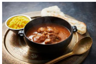
チキンコルマカレー（もっとクック専用）