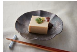
ごま豆腐（もっとクック専用）