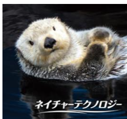
ラッコの爪や手にならったブラシ部分

保温のため多数の体毛で覆われているラッコは、多くの時間をグルーミング（毛づくろい）に費やします。爪や手のひらを上手に使いながら毛と毛の間に効率良く空気を送り込むことで、極寒の海でも体温が奪われないように暮らしていると言われていました。今回、スムーズなブラッシングを実現するため、ブラシ部分にラッコの爪や手にならった新たな当社独自の「ネイチャーテクノロジー」を採用。交差して絡んだ髪を横方向に広げる太いピンと、くしの通りをなめらかにする細い長短のピンを組み合わせたブラシ形状で、髪の絡まりを軽い力でほどこき、毛先の負担を軽減します。