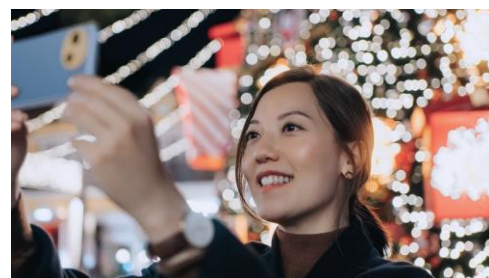
夜景の自撮りも高画質に撮影できる