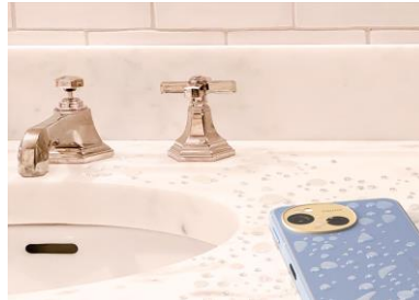
水がかかっても安心な防水対応

本体デザインは、デザイナー・三宅一成氏が設立した「miyake design」が監修。カメラの周りの色をアクセントにしたデザインが楽しめるブルーをはじめ、全体のトーンを同系色で揃えたデザインなど、豊富な5色からお選びいただけます。約166gと軽く持ちやすいサイズのボディは、「MIL-STD-810H（耐衝撃落下はMIL-STD-810G）」準拠の防水・耐衝撃にも対応し、日常生活で安心して使用できます。