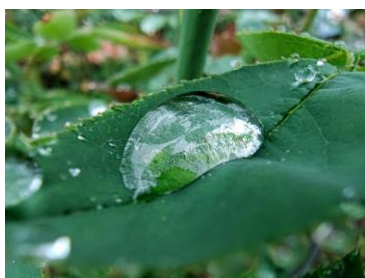
約2.5cmの接写が可能なマクロ撮影に対応

「AQUOS R pro」シリーズの高画質化技術を応用した画質エンジン「ProPix」の搭載により、豊かな階調表現で細部の質感まで美しく表現します。5,030万画素の標準カメラは、集光量の大きい1/1.5インチのイメージセンサーと光学式手ブレ補正（OIS：Optical Image Stabilizer）を搭載し、ブレを抑えて明るくキレイに撮影できます。同じく5,030万画素の広角カメラは、約2.5cmの接写が可能なマクロ撮影から超広角まで幅広いシーンに対応。オートフォーカス機能により、すばやくピントを合わせる事が可能です。アウトカメラはもちろん、3,200万画素のインカメラもナイトモードに対応しているので、イルミネーションなどの暗い場面でも高画質な自撮りを楽しめます。