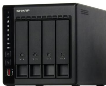
「COCORO OFFICEサーバー」<BP-X2STシリーズ>