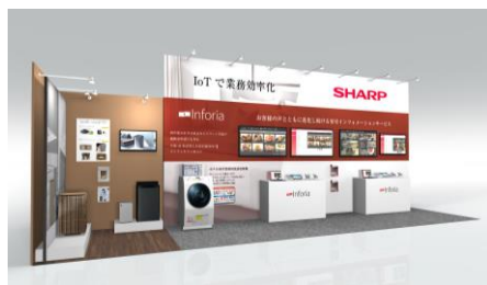
シャープブースイメージ

シャープは、明日2月4日（火）から7日（金）まで東京ビッグサイト（東京都江東区）で開催される外食・ホテル・レジャー業界向けの商談専門展「第53回 国際ホテル・レストラン・ショー」に出展します。人手不足が課題となっているホテル業界の業務効率化に貢献する当社のソリューションを提案します。