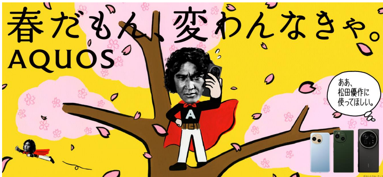
JR渋谷駅構内に掲示されるスマートフォン「AQUOS」の交通広告グラフィック

シャープは、首都圏および関西圏のJR駅構内において、スマートフォン「AQUOS」の交通広告を本日3月3日（月）から展開します。ブランドアンバサダーは昨年につき、松田優作氏を起用しています。