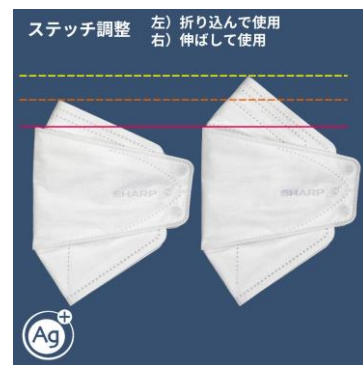
ステッチによるサイズ調整

鼻の部分に施されたステッチ（縫い目）を利用して不織布を下方向に折り込むことで、マスクの縦方向のサイズ調整が可能です。個人ごとにフィット感の高いポジションでマスクを装着いただけます。