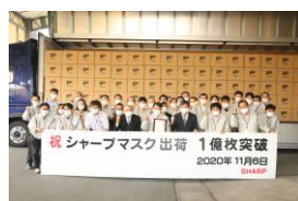
(E) マスク出荷1億枚突破