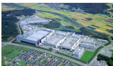
(A) マスク生産拠点（三重工場）