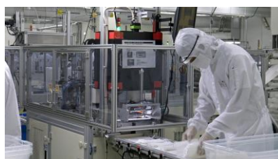
(B) マスク生産の様子