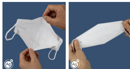
●画像のマスク色は、ホワイト系です。

マスクを外した際には、口元側の不織布が内側に閉じこむように、折りたたんで収納することができます。衛生面で安心、かつ、マスクの内側が露出しないため見栄えも良く、周囲への配慮にも繋がります。