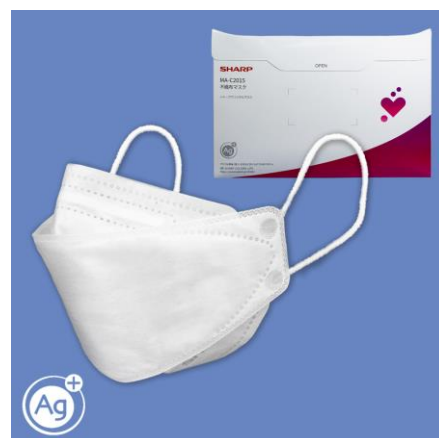
(G) 『シャープクリスタルマスク』