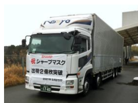
(F) マスク出荷2億枚突破