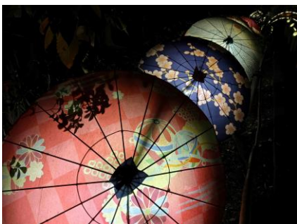
新イメージセンサーにより 暗部のノイズを低減

動画も「Dolby Vision ® 」により、鮮やかな色彩で撮影できます ※4 。AIが被写体の動きを予測して追尾するオートフォーカスは動画にも対応 ※5 。被写体が一時的に物陰などに隠れても捉え続けられます。