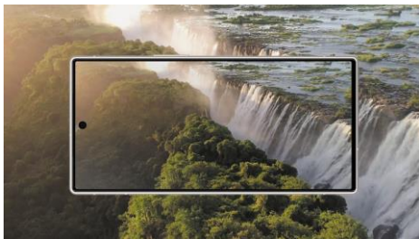
ピーク輝度3,000nitのPro IGZO OLED（イメージ）

また、大型のスピーカーBOXを上下に搭載。上部のスピーカーBOXをフルメタル化することで音圧を増し、パワフルなサウンドを実現しました。立体音響技術「Dolby Atmos ® 」にも対応し、その場にいるような音の広がりや臨場感を楽しめます。音量に合わせて周波数特性を制御する新音響技術により、音量を小さくしても高域や低域が聴き取りやすくなりました。イヤホンで聴く音も、「8Way Audio」技術により空間オーディオへの変換が可能です。