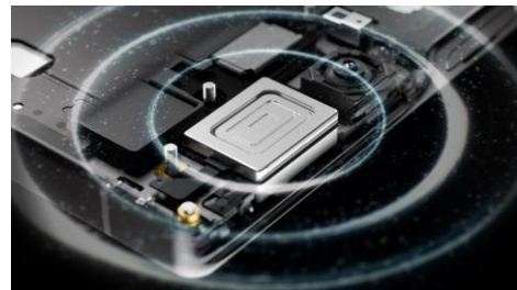
フルメタルBOXスピーカー（イメージ）

※3 なめらかハイスピード表示およびゲーミングメニューの登録ゲーム設定をONにしたアプリでは毎秒120回の表示更新に連動して間に黒画面を挿入し、OFF時（毎秒60回表示状態が変化）の4倍の毎秒240回の表示状態の変化を実現。アプリケーション側の仕様により、4倍速（240Hz）表示にならない場合があります。