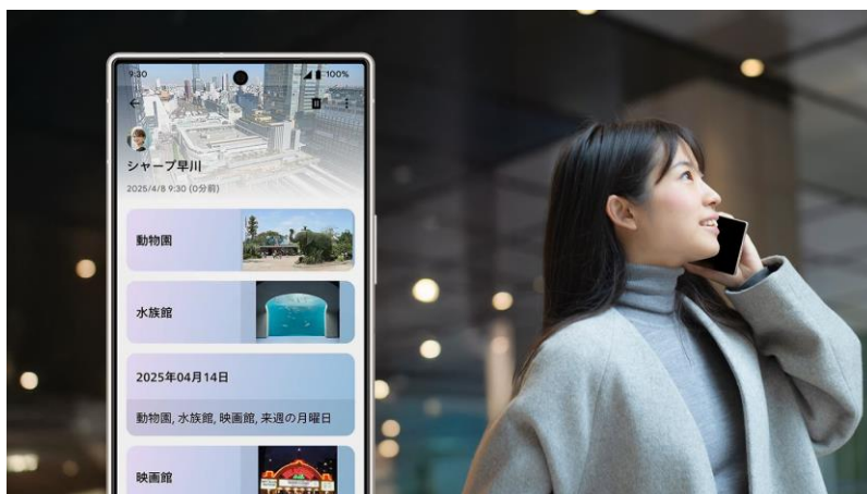
生成AIが会話中のキーワードをリスト表示（イメージ）

通話の際に、生成AIが会話中のキーワードを自動で抽出してメモに残す機能に対応。通話後に、キーワードを見やすくリスト化して表示します。また、メモに「日時」がある場合はカレンダーアプリへの予定追加を自動で提案し、簡単に予定を登録できる機能も新たに搭載しました。