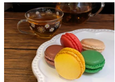
“見たまま”に近い自然な色合いの写真を撮影できる