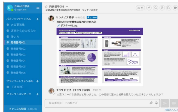
ポスターセッションチャンネル上での質疑応答（イメージ）

「ポスターセッションプラン」のほか、大人数ビデオ会議を設定できる拡張プラン「ビデオPack」や「ウェビナーPack」も導入できるので、基調講演や学会後の交流懇親会など、ニーズに合わせて利用できます。